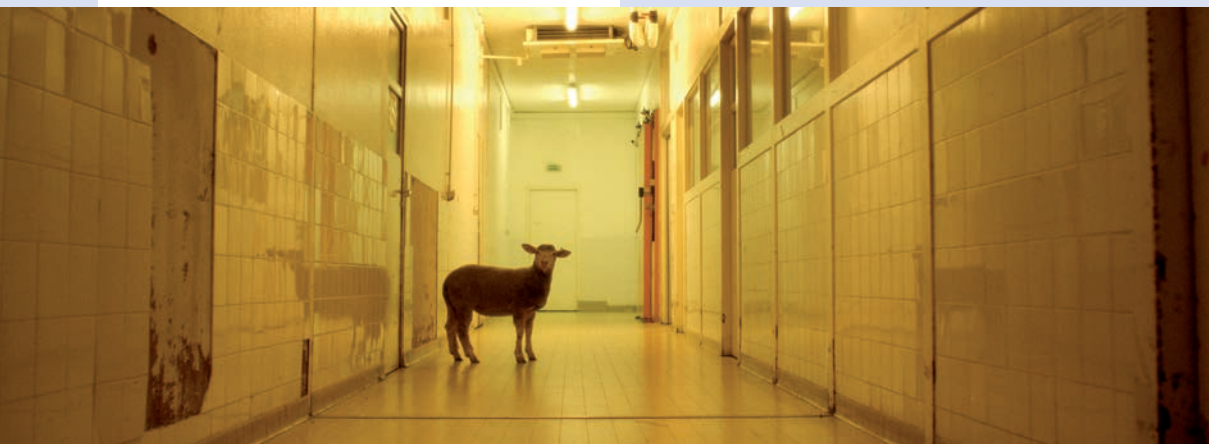
GORGE CŒUR VENTRE