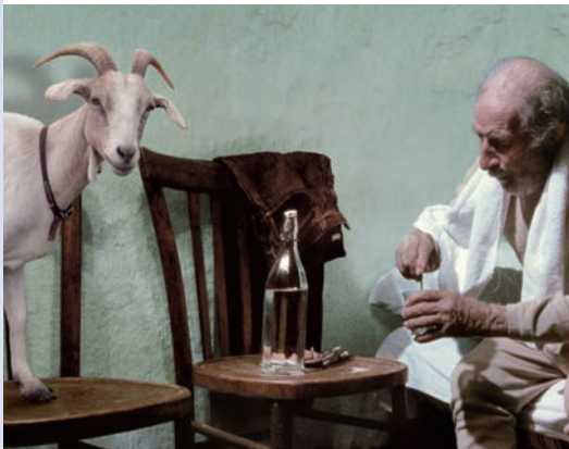
LE QUATTRO VOLTE