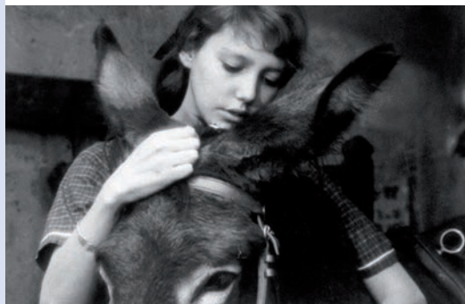
AU HASARD BALTHAZAR

Estimé de la bonne société victorienne, le Docteur Jekyll, médecin londonien, est convaincu qu'il est possible de dissocier chimiquement le bien du mal au sein du psychisme humain. Un soir, Jekyll expérimente sur lui-même la substance qu'il a mise au point : il se dédouble en un Mister Hyde sadique.