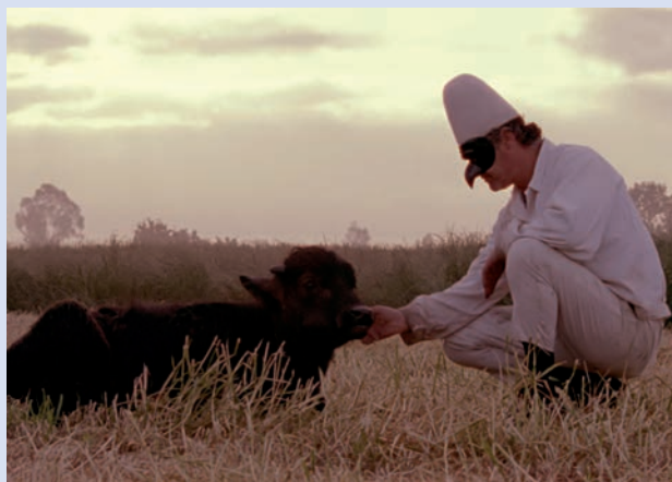
BELLA E PERDUTA