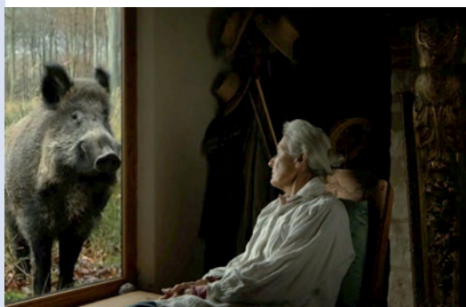
VA, TOTO !

Les réalisateurs embarquent sur un chalutier pour dresser le portrait d'une des plus vieilles entreprises humaines. À travers un flot d'images sidérant, un témoignage de l'affrontement qui engage l'homme, la nature et la machine.