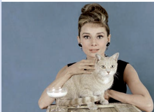
LE CHAT LE PLUS POPULAIRE

https://blogs.mediapart.fr/cinema-lecran/blog