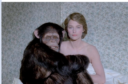
MAX MON AMOUR

Tilikum est une orque agressive. En captivité dans un parc aquatique, elle a tué trois personnes. Mais sa violence ne découle-t-elle pas de sa vie en captivité ? Avec l'appui d'images choquantes, Blackfish fait intervenir des spécialistes qui luttent pour le maintien de ces animaux à l'état sauvage.