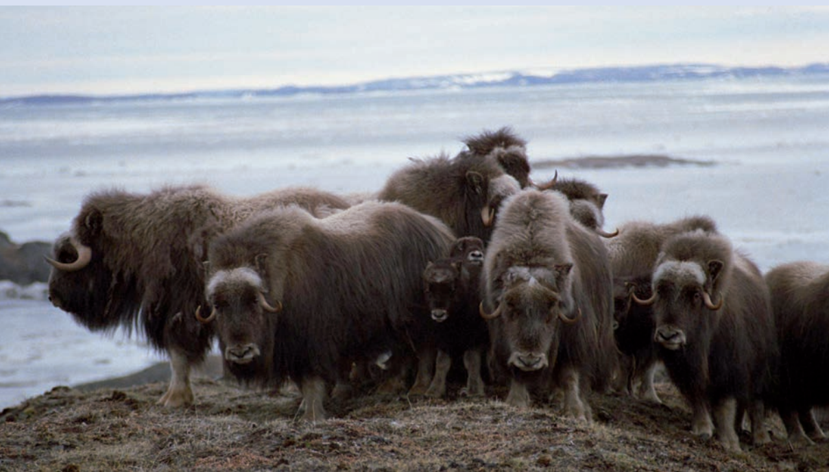
L'OUIMIGMAG OU L'OBJECTIF DOCUMENTAIRE