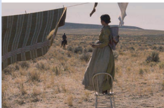
LA DERNIÈRE PISTE