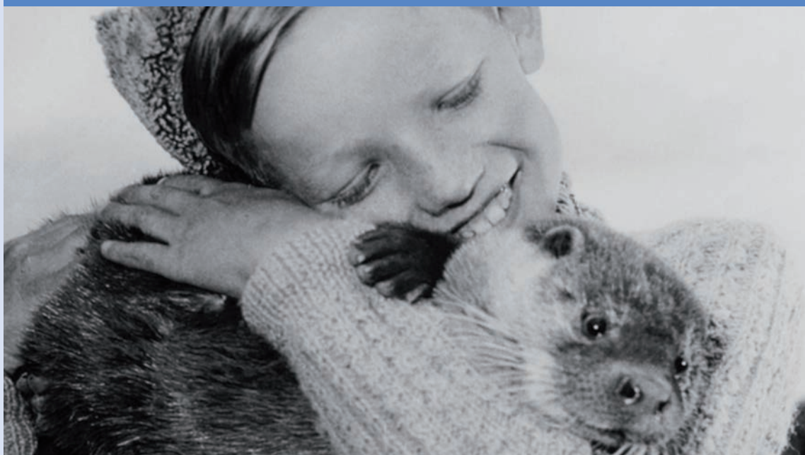
LA GRANDE AVENTURE

ARNE SUCKSDORFF (1917-2001), peu connu en France, est l'un des plus célèbres documentaristes suédois de l'après-guerre. Symphonie d'une ville , l'un de ses premiers courts-métrages (récompensé d'un Oscar en 1949), se rattache aux documentaires plus anciens de la Nouvelle Objectivité, caractérisés par leur attention aux formes et rythmes accélérés des villes. Procédant par saynètes brèves et graphiques, Sucksdorff observe les variations météorologiques de Stockholm, les travailleurs et les flâneurs autant que la faune locale. Des enfants épient une bande de mouettes derrière la vitre, qui les regardent en retour, survolent la ville, engloutissent les petits poissons pêchés à la ligne par un gamin du port. Le cinéaste se passionne pour la gamme complexe et éclatée des interactions entre des êtres – humains ou animaux – qui partagent un même espace, un milieu qu'il observe sans prendre parti. Dans son court documentaire animalier Un monde divisé (1948), la forêt nocturne et silencieuse devient un petit théâtre de film noir mettant en scène, sur la neige noyée d'ombres, les rencontres funestes d'une hermine fureteuse, d'un renard à la massivité lente, d'un lièvre vagabond et d'une chouette rapace – croisements meurtriers dont la maison illuminée