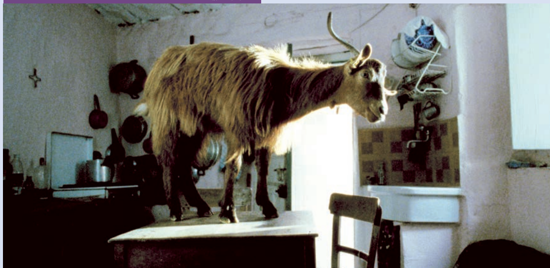
LE QUATTRO VOLTE