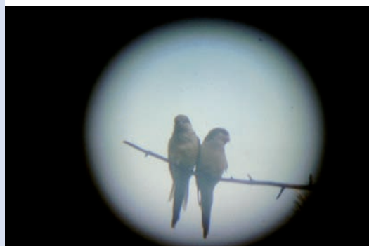
LES BÊTES SAUVAGES