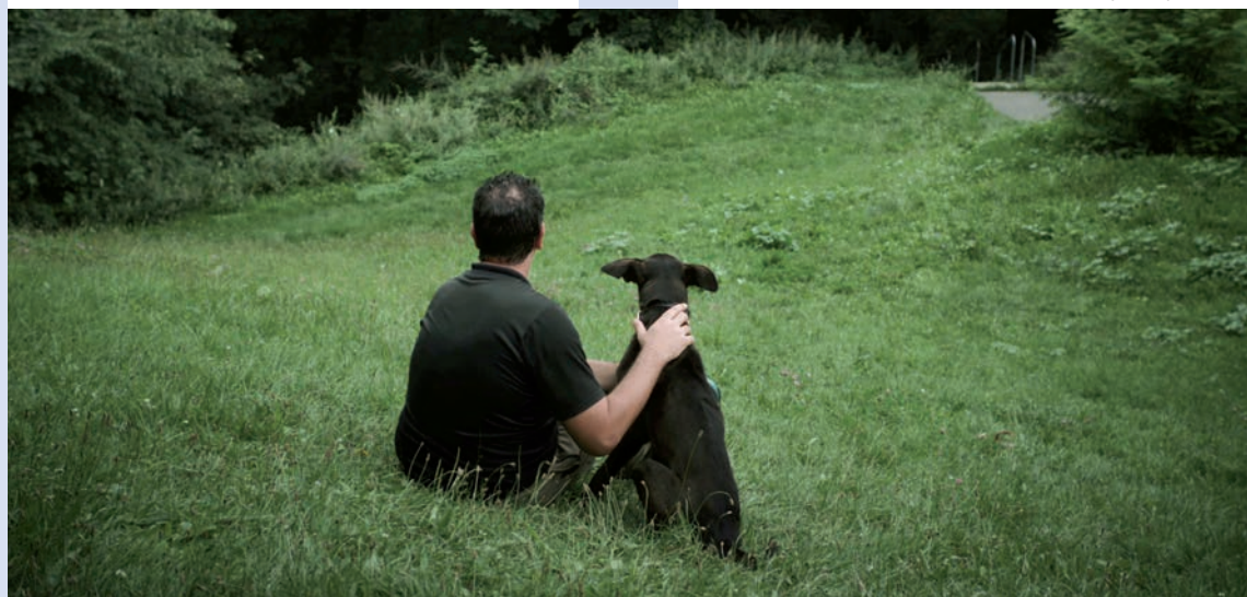
UN DIMANCHE MATIN

Un garçon de 10 ans se débat avec les amertumes de la vie dans une colonie de vacances. Ce n'est pas simple d'être ignoré par la prune de ses yeux et de voir son dortoir vandalisé par des voyous presque adolescents. Heureusement, dans la forêt, les dahus s'obstinent à ne pas se montrer.