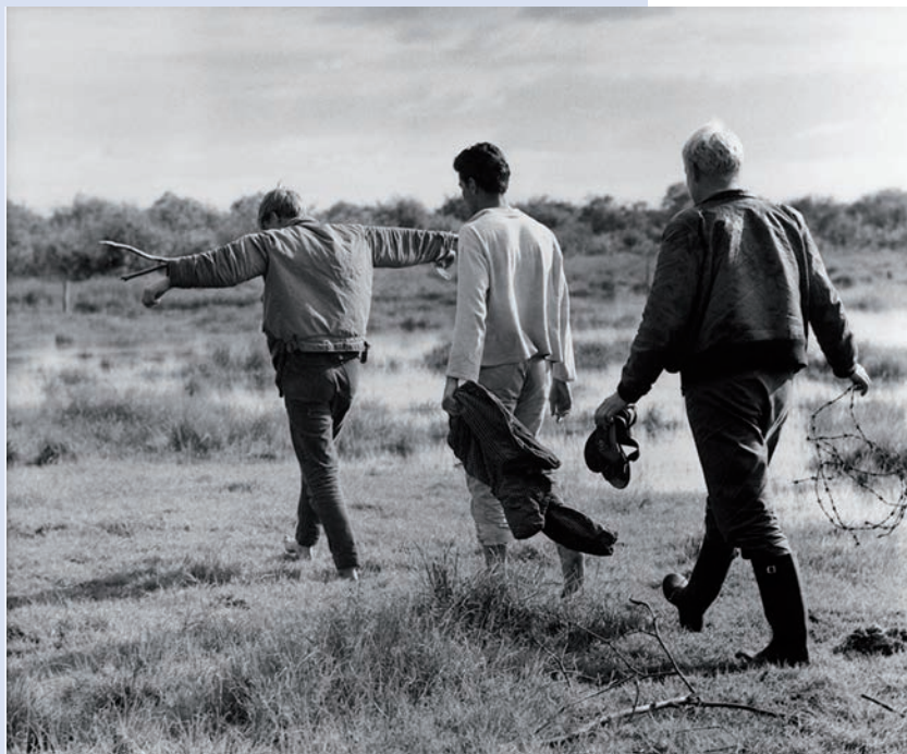
LE GARÇON DANS L'ARBRE

ANDRÉ BAZIN, FRANCE OBSERVATEUR N° 269, 7 JUILLET 1955